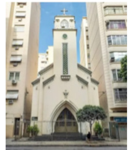
IP Copacabana – Foto atual