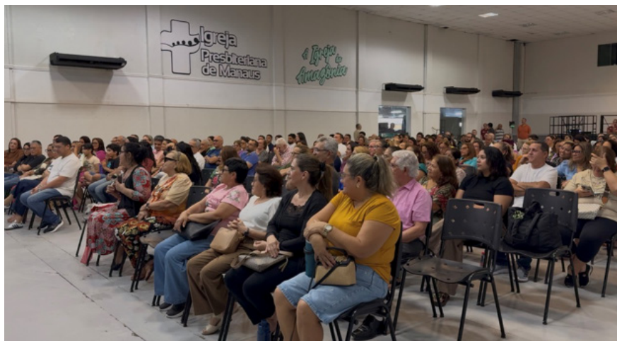
Voluntários durante capacitação

Durante a capacitação, foram apresentadas as principais fren-