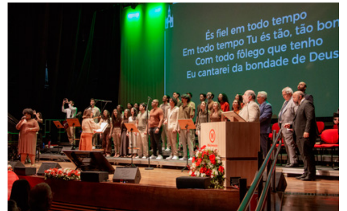
Coral em apresentação no culto de 125 anos

ras, foi originada pela IP Unida de São Paulo. A Casa Editora Presbiteriana, teve seu início aqui na rua Helvétia, nas instalações de nossa Igreja Unida. A Junta de Missões da IPB teve suas origens nas instalações desta amada igreja. Alguns dos primeiros programas de rádio com a pregação do evangelho, com alcance nacional, também foram apoiados pela Igreja Unida.