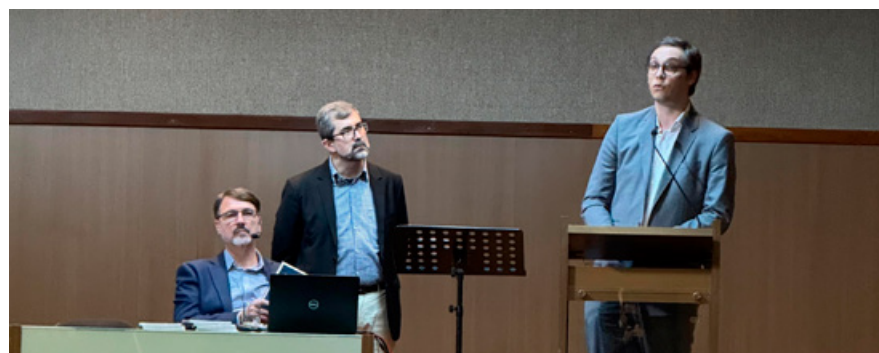
Lançamento do livro “Salmos em Contexto”