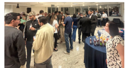
Loja da ECC movimentada durante lançamento