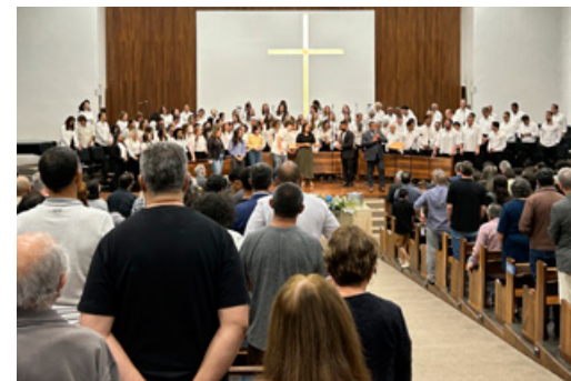
Grande coral no culto de 166 anos da IPB