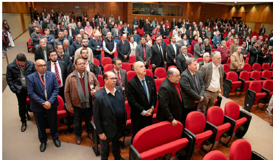
Público durante o Culto de Ação de Graças pelos 166 anos da IPB, no auditório Ruy Barbosa