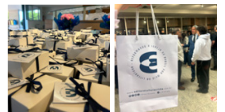
Lembranças aos convidados presentes