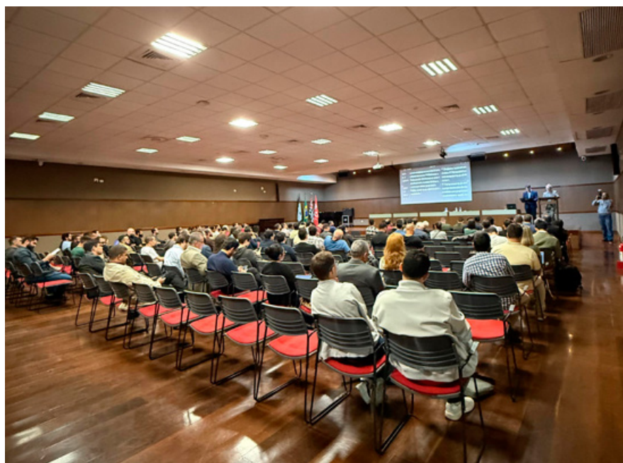
Auditório da Escola Americana

O livro Salmos em Contexto já está disponível para compra no site oficial da editora: www.editoraculturacrista.com.br . Já Toda armadura de Deus estará disponível a partir do dia 8 de setembro nos canais oficiais de vendas da ECC.