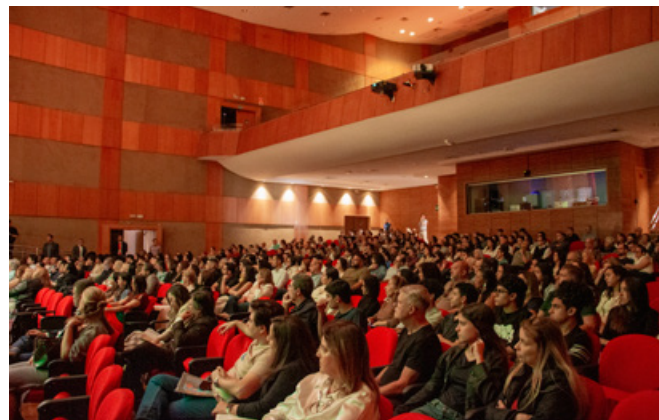
Membros da IP Unida e convidados no culto de celebração