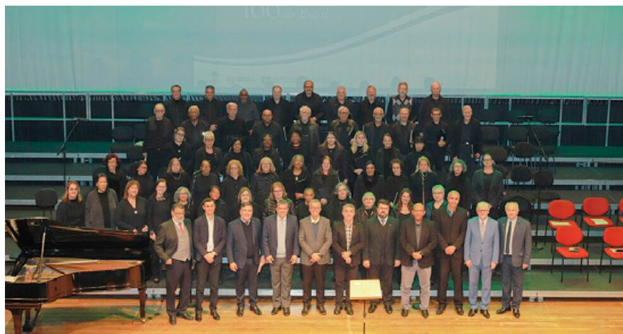
Autoridades do Mackenzie e líderes da IPB frente à Coral Intersinodal