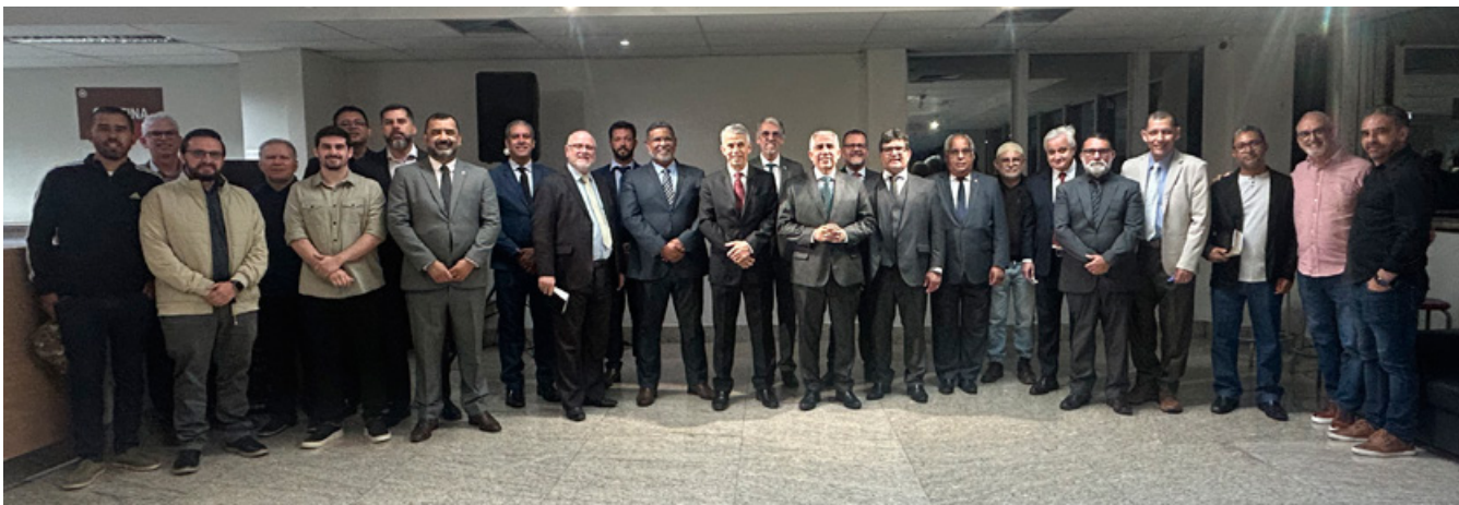
Pastores e autoridades da IPB presentes no evento