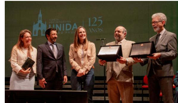
Entrega de placas comemorativas