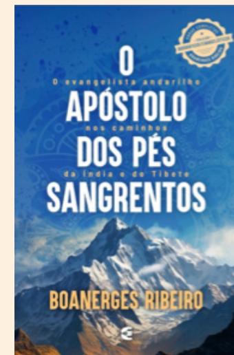
O livro retorna a sua editora original nesta edição de 2024