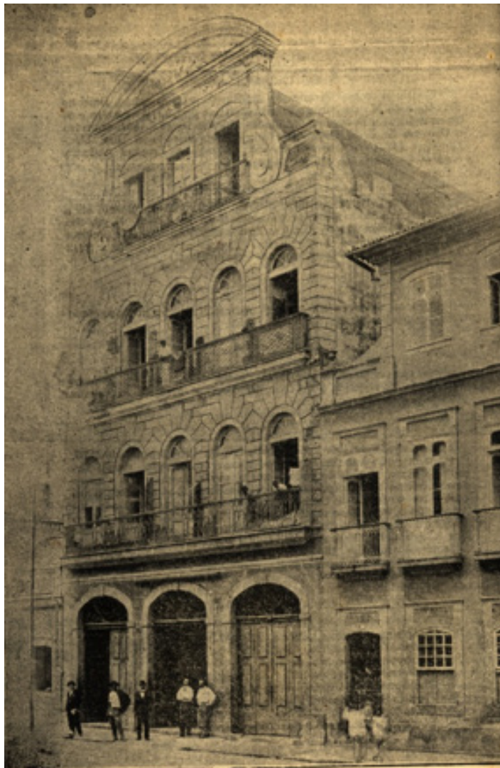
Edifício em que funcionaram tanto a IP do Rio de Janeiro quanto o Seminário Primitivo, fundado por Simonton em 14 de maio de 1867. O seminário ficava no terceiro pavimento. No segundo pavimento estava o salão dos cultos. O imóvel estava localizado defronte ao Campo de Santana, atual Praça da República. O local hoje é ocupado pelo Quartel Central do Corpo de Bombeiros do Rio.

O perfil de nossos seminaristas mudou ao longo dos anos. Atualmente, temos mais alunos casados que solteiros, e a maioria dos