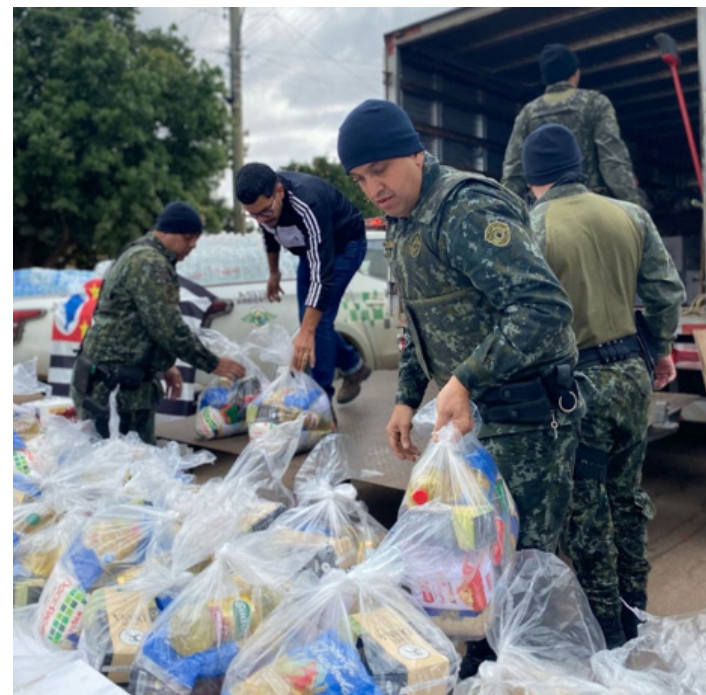
Polícia militar de SP ajudando na entrega de doações

Em épocas de crises ou calamidades, lembremos que o nosso Deus é Poderoso para reverter os quadros e transformar os cenários mais nefastos no palco da glória da sua graça. Assim oramos para que Cristo abençoe a cidade de Eldorado do Sul e nos permita ver muitas almas convertidas e os eleitos sendo reunidos para adoração ao Cordeiro Santo de Deus.