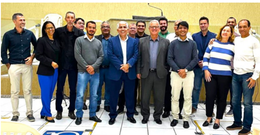
Secretários de Apoio Pastoral do estado de Minas Gerais

Pastoral) conduziram as palestras do evento.