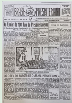
Brasil Presbiteriano, nº 1, setembro de 1958