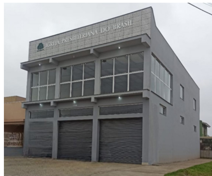
Prédio onde acontecem os cultos em Eldorado do Sul

Que na cidade de Eldorado do Sul brilhe a luz de Cristo no coração da população, para que encontre nele o verdadeiro tesouro, mais precioso que o ouro e capaz de transformar por completo o ser humano.