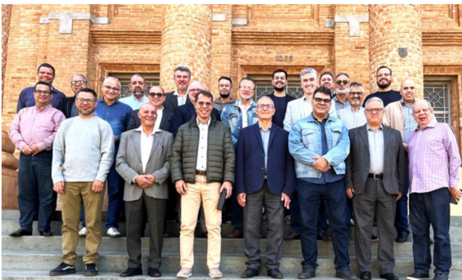
Secretários de Apoio Pastoral do estado de São Paulo