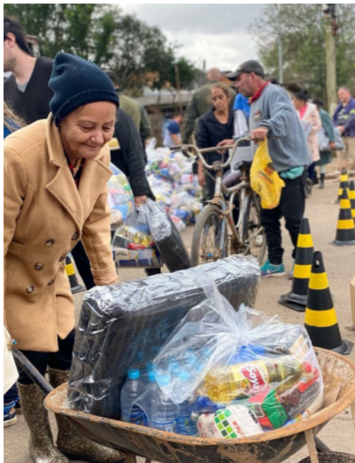
Pessoas recebendo doações

Desde os primeiros contatos com a cidade, já começamos a sonhar e imaginar a possibilidade de iniciar o plantio de uma igreja no local, pois a crise era grande e isso comoveu nosso coração. Daí, todos os dias