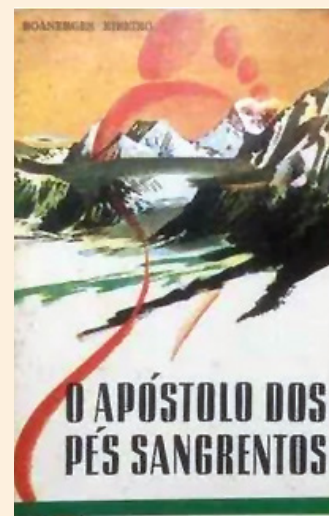
Capa das primeiras edições do livro, publicadas pela CEP