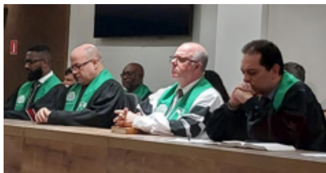
Parte da Mesa diretora da cerimônia