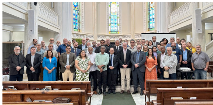
Lideranças do Estado do RJ se reúnem para oração, reflexão e comunhão em comemoração aos 165 Anos do Presbiterianismo no Brasil