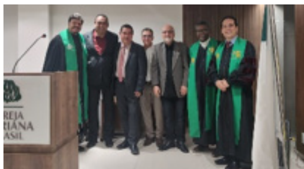
Concluintes do curso de pós-graduação em Plantação e Revitalização de Igrejas