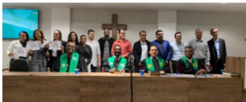
Concluintes do Curso Introdutório de Teologia