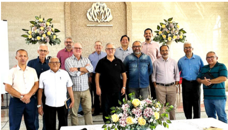
Secretários de Apoio Pastoral e pastores interessados